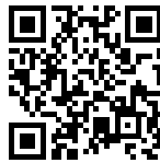
TABLE CUISSON INDUCTION PUNTO - NOIR 58x51 4 ZONES